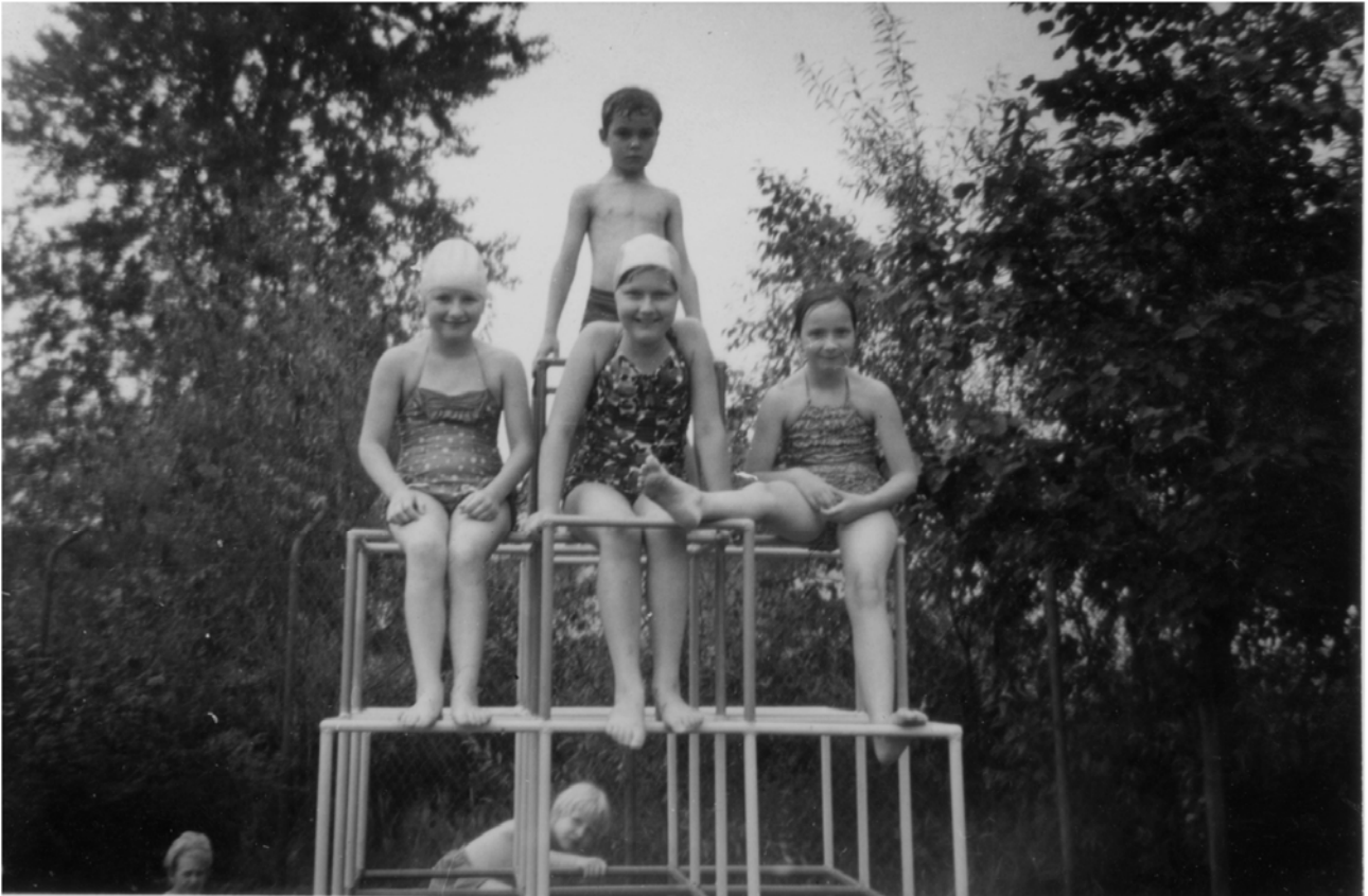
Kinder spielen in Stockum, Hermann - Breymann - Bad, 1962

Wir schreiben das Jahr 1962. Das Hermann – Breymann - Bad hat gerade zwei Jahre geöffnet. Ein Quaderklettergerüst lädt zum Klettern ein.