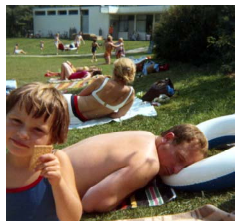
und Papa Hörskén passt auf die Rasselbande auf ! - oder ?